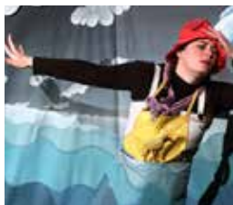
LE BRUIT DES COULEURS (2005)

Les voyageurs immobiles proposent à tous un voyage pour l'imaginaire. Il suffit d'un brin de fantaisie, d'une goutte de sensibilité et d'un soupçon de curiosité pour entrer dans ces univers biscornus mêlant poésie des images et des sons.