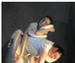
TOUCHE À TOUILLE (2008)