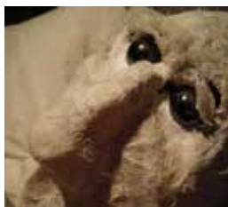
AINSI VA L'AILLEURS (2011)