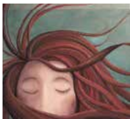
ET LES NUAGES DORMENT SUR MES PAUPIÈRES (2007)