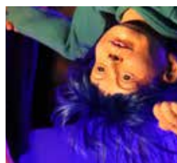
MALICE, DE RETOUR DU PAYS DES MERVEILLES (2024)