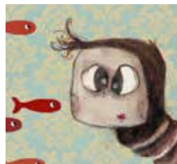
PETITE CHIMÈRE (2016)